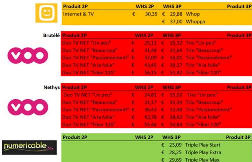
Figure 13 : comparaison des prix de gros obtenus au départ des prix de détail « double play » et « triple play » (sur base des tarifs de détail observés au moment de la consultation nationale et des minis déterminés dans la décision de la CRC du 11 décembre 2013)