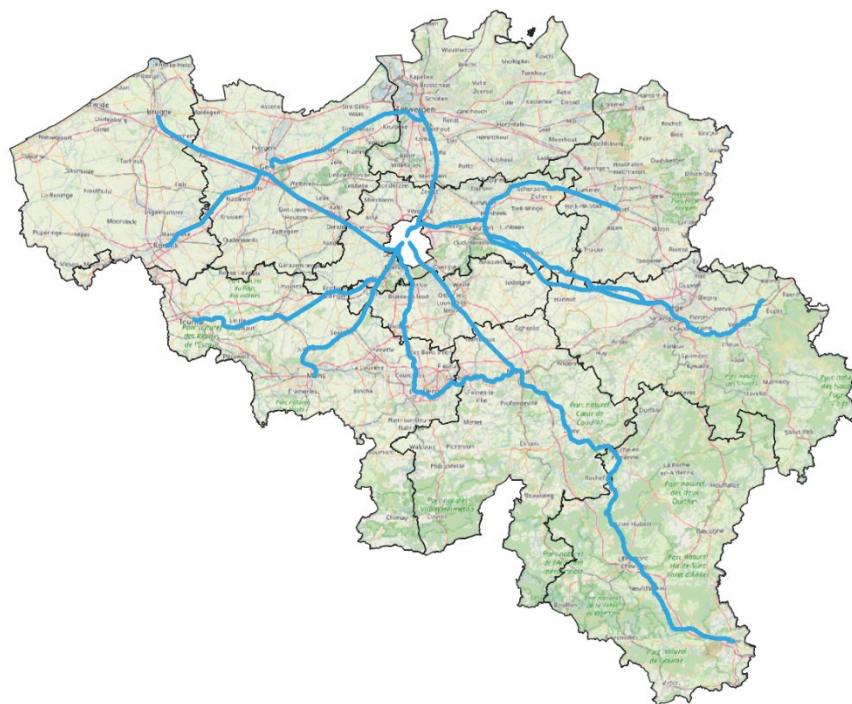
Figure 3 : Carte des lignes ferroviaires principales selon l'AR 700 MHz

Sur la base d'un échantillon de points de mesure situés sur 16 lignes ferroviaires principales 3 , des mesures ont été effectuées à bord de trains de voyageurs, tant en heure creuse qu'en heure de pointe.