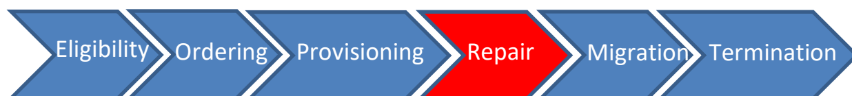
Figure 11 : Applicabilité du SLA au niveau de la relation client