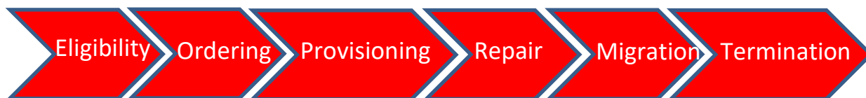
Figure 2 : Applicabilité du SLA au niveau de la relation client