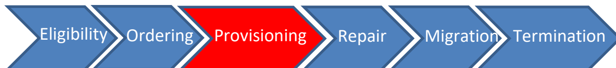
Figure 7 : Applicabilité du SLA au niveau de la relation client