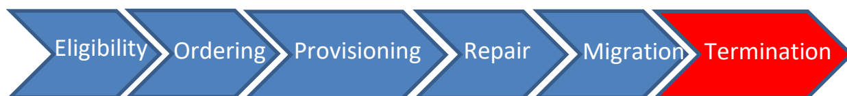
Figure 1 : Applicabilité de la désactivation au niveau de la relation client