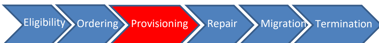
Figure 4 : Applicabilité du SLA au niveau de la relation client