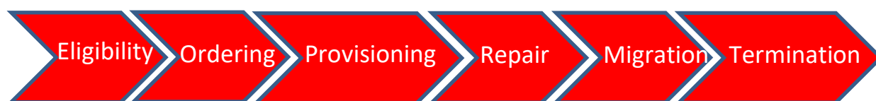
Figure 3 : Applicabilité du SLA au niveau de la relation client