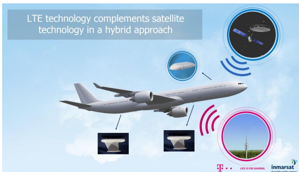
Schéma 1 : Extrait de la présentation d'Inmarsat intitulée « Inmarsat – The mobile satellite company », Munich, 21 avril 2016 18 .

20. D'une part, il y aura une voie de radiocommunication entre des stations terrestres air-sol situées au sol et des terminaux terrestres ( i.e. les antennes et leurs émetteurs, récepteurs et modem associés, nécessaires pour établir une communication air-sol) situés sous le fuselage de l'avion 19 . Les terminaux terrestres sont représentés sous l'avion sur le Schéma 1 ci-dessus. Les stations terrestres air-sol sont représentées dans le cercle rose. D'autre part, il pourrait 20 y avoir une autre voie de radiocommunication distincte entre un terminal satellite ( i.e. les antennes et leurs émetteurs, récepteurs et modem associés, nécessaires pour établir une communication satellitaire distincte), installés au-dessus du fuselage de l'avion . Le terminal satellite est représenté dans le plus petit cercle bleu sur le Schéma 1.